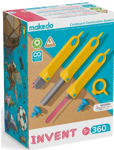
①だいぼうけんセット ¥23,980