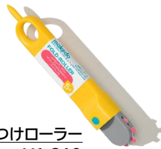
⑧折り目つけローラー ¥1,210