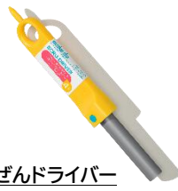
⑥あんぜんドライバー