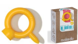
⑤あなあけドライバー ¥880