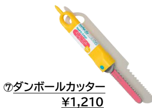
⑦ダンボールカッター ¥1,210