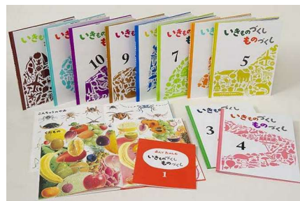
『いきものづくしものづくし 全12巻』 ¥29,040(各¥2,420) 新刊の中で多くの園で活用されていたシリーズ。