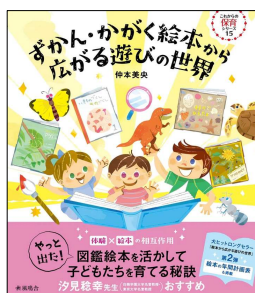
『ずかん・かがく絵本から 広がる遊びの世界』 ¥2,200

絵本をこどもたちと楽しみたい、活用を見直したい、とお考えであれば、このシリーズがオススメです。今回の新刊は『ずかん・かがく絵本から広がる遊びの世界』。おはなしから遊びに展開するのはマスターしていても、図鑑や科学の絵本はイマイチ取り込めない、一部のこどもが熱狂している本、のイメージをお持ちではないでしょうか？こどもの生活と本を結び付け、遊びにも広げられるのがかがくの本です。本書では園でよく見知った本がたくさん。明日から使えるヒントにあふれています。まず知っている本から手に取ってこどもたちと見てみましょう！