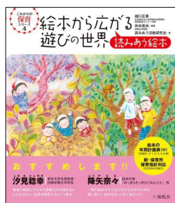
『絵本から広がる遊びの世界』 ¥2,200 絵本の年間計画表付き！